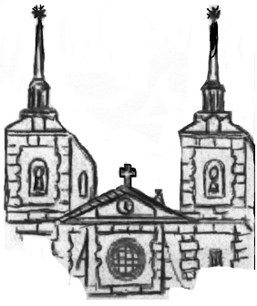
PARROQUIA SAN MIGUEL DE PAMPLONA